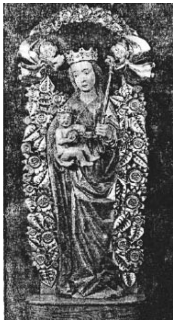
Cudowna Matka Boża Przeczycza

Tyś jesteś pełna łaski, dobroci i miłosierdzia. Przed Twym świętym wizerunkiem ofiaruję Ci, o Maryjo, moje serce, a z nim polecam Ci wszystkie moje sprawy, szczególnie zaś sprawę mojego zbawienia.