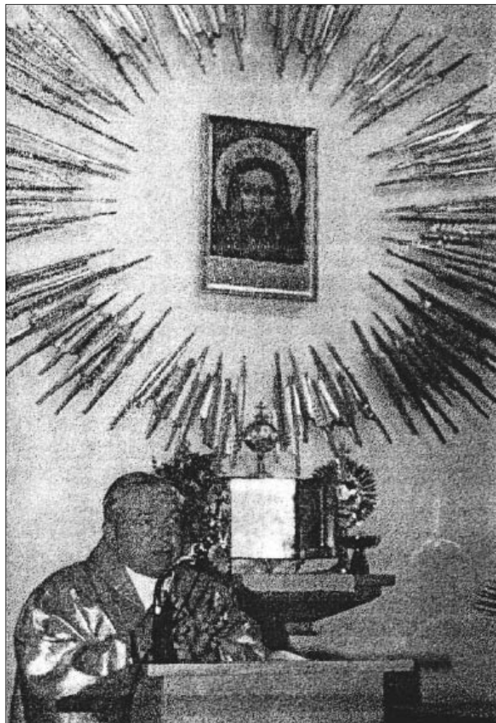
Kaplica w Bukowej pw. Przemienienia Pańskiego