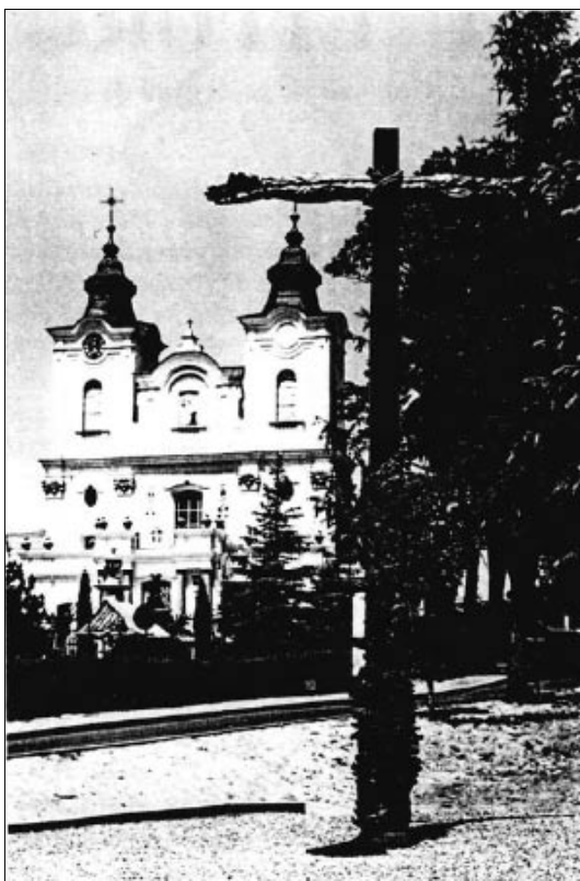
Krzyż Pojednania i kościół oo. Bernardynów w Dukli

Nie da się też opisać wrażeń ze szczytu Połoniny Wetlińskiej. To już druga część wycieczki - czysto turystyczna. Z Dukli jedziemy w stronę Bieszczadzkiego Parku Narodowego. Zostawiamy autobus, który ma kłopoty z chłodzeniem. Teraz sympatyczny kierowca będzie miał czas zająć się jego naprawą. My zaś kupujemy bilety wstępu do Parku, oglądamy galerię rzeźby na świeżym powietrzu. I w górę. Początek niezbyt trudny. Potem im wyżej tym bardziej stromo. Wycieczka samoczynnie zaczyna się dzielić na grupy wiekowe. Ci idący na końcu pocieszają się, że i tak bez nich autobus nie odjedzie. Po wyjściu z mokrego lasu wchodzimy na rozległe, porośnięte wysokimi trawami łąki. I dalej w górę do