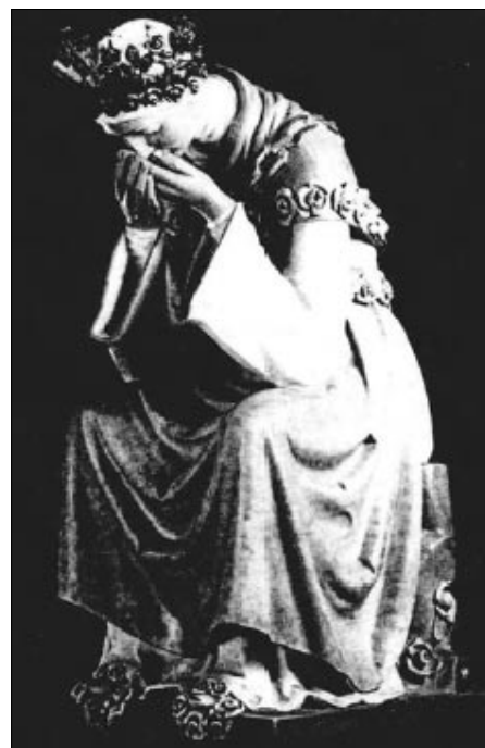
Łaskami słynąca figura Matki Bożej Saletyńskiej w Dębowcu

Potem do autobusu i w drogę, ale tylko kawałek. Za chwilę trzeba wysiąść by zbyt nie obciążać drewnianego mostu. Po niedługim czasie dojeżdżamy do Dukli. Czyste, posprzątane miasteczko z pięknie utrzymanym kościołem i robiącym duże wrażenie, również artystyczne, krzyżem z brązu stojącym obok wykonanej z tego samego materiału postaci św. Jana. To trzeba zobaczyć, słowami nie można oddać piękna i majestatu rzeźb. Podjeżdżamy do pustelni św. Jana autobusem, ostatni odcinek pokonujemy pieszo. Nagrodą za trud jest źródłana woda i modlitwa w starym kościele.