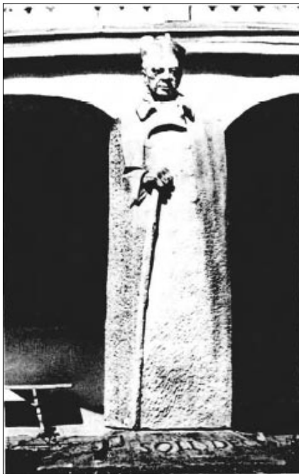
Pomnik Prymasa Kardynała Stefana Wyszyńskiego w Komańczy

więziony był Prymas Kardynał Stefan Wyszyński. Następnie udaliśmy się już w drogę powrotną do domu, gdzie po krótkim przystanku w Dukli przed klasztorem oo. Bernardynów dotarliśmy do Brzostku ok. godz. 23 30 .